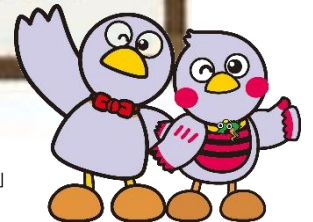
埼玉県マスコット「コバトン」「さいたまっち」

公営住宅には高齢者の方が多くお住まいのため、周囲の方の気配りが重要になります。ちょっとした異変に気づいたら、管轄支所までご連絡（相談）をください。人命救助につながる可能性があります。