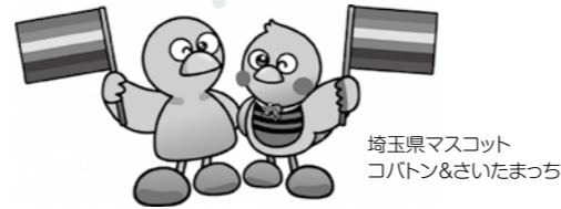
埼玉県マスコット コバトン&さいたまっちゃん

LGBTQとは、性的マイノリティを表す総称のひとつです。人の性のあり方は様々です。