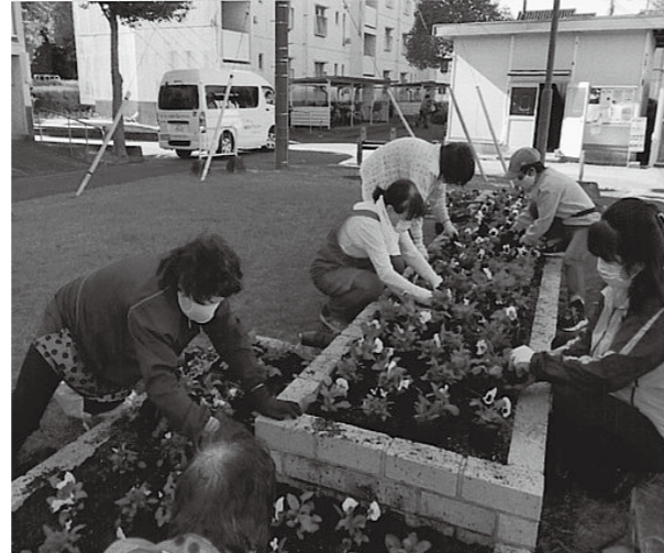
* 苗の植え込み *

パンジーの花を頂き、ありがとうございます。植え込み作業は、役員と花の好きな方で行いました。皆さん花の好きな方ばかりだったので、花の話で花がさき、花のおかげで笑い声がありました。パンジーが花壇におさまり、また話もはずみ、とても良かったと思えました。『最後にきれいに咲いてね、私たちも努力しますから』と花にみんなで声を掛けました。団地に住んでいる方が見てくれると思うと、花をいただき感謝の思いでいっぱいです。ありがとうございました。