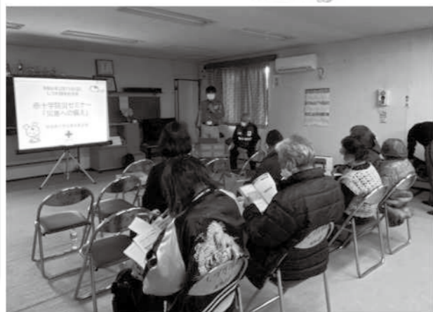
～防災セミナーの様子～